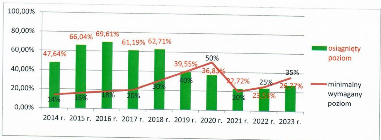
Rys. 1. Osiągnięte poziomy przygotowania do ponownego użycia i recyklingu odpadów komunalnych: papieru, metalu, tworzyw sztucznych i szkła do 2020 r. oraz osiągnięte poziomy przygotowania do ponownego użycia i recyklingu odpadów komunalnych od 2021 r.

z 2021 r. poz. 1530), a także Rozporządzeniu Ministra Środowiska z dnia 15 grudnia 2017 r. w sprawie poziomów ograniczenia składowania masy odpadów komunalnych ulegających biodegradacji.