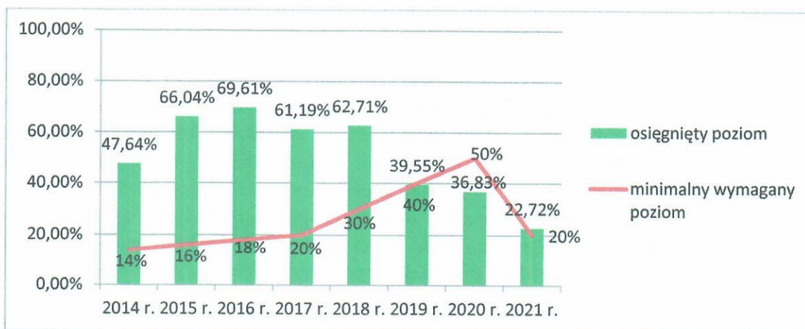
Rys.1. Informacje o osiągniętych poziomach przygotowania do ponownego użycia i recyklingu odpadów komunalnych: papieru, metalu, tworzyw sztucznych i szkła do 2020 r. oraz osiągniętym poziomie przygotowania do ponownego użycia i recyklingu odpadów komunalnych w 2021 r.

Poniżej przedstawiono osiągnięte przez Miasto Łowicz poziomy przygotowania do ponownego użycia i recyklingu odpadów komunalnych oraz poziom ograniczenia masy odpadów komunalnych ulegających biodegradacji przekazywanych do składowania w latach 2014–2021. Dane zostały podane również w odniesieniu do poziomów ustalonych do osiągnięcia przez gminy w poszczególnych latach, wskazanych w uchylonym już Rozporządzeniu Ministra Środowiska z dnia 14 grudnia 2016 r. w sprawie poziomów recyklingu, przygotowania do ponownego użycia i odzysku innymi metodami niektórych frakcji odpadów komunalnych oraz obowiązującym od 4 września 2021 r. Rozporządzeniu Ministra Klimatu i Środowiska z dnia 3 sierpnia 2021 r. w sprawie sposobu obliczania poziomów przygotowania do ponownego użycia i recyklingu odpadów komunalnych (Dz. U. z 2021 r. poz. 1530) , a także Rozporządzeniu Ministra Środowiska z dnia 15 grudnia 2017 r. w sprawie poziomów ograniczenia składowania masy odpadów komunalnych ulegających biodegradacji .