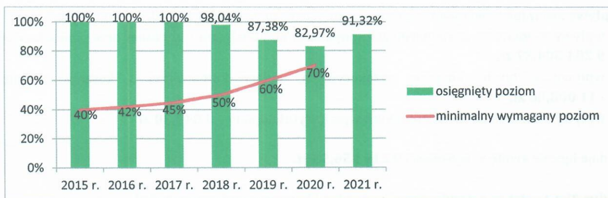
Rys. 2. Informacje o osiągniętych poziomach przygotowania do ponownego użycia i recyklingu innych niż niebezpieczne odpadów budowlanych i rozbiórkowych.