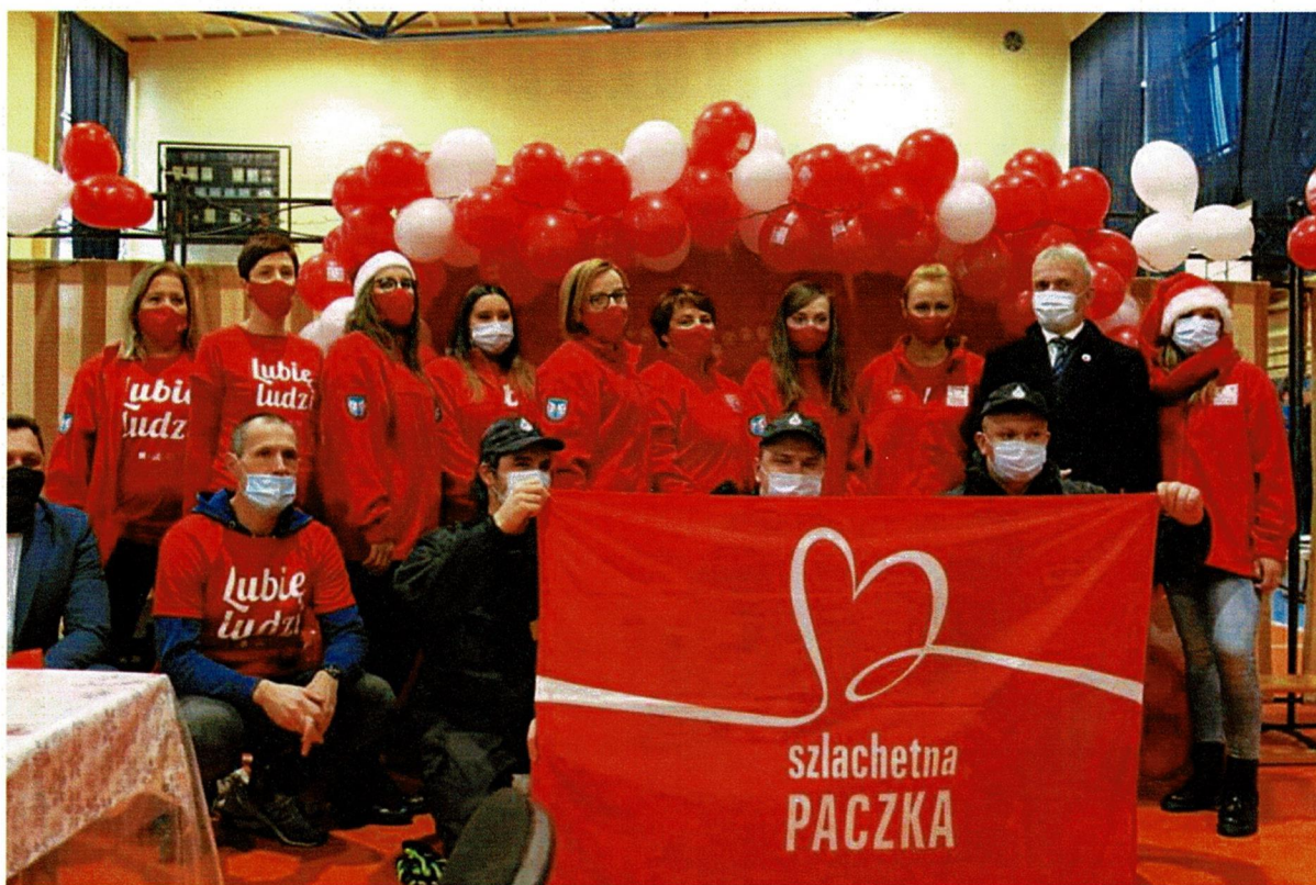
Finał Szlachetnej Paczki, 11-12 grudnia 2021 r.

Wartym podkreślenia jest fakt, że dzięki nowym przestrzeniom w i przy budynku Urzędu Miejskiego w Al. Sienkiewicza 62 otwierają się kolejne możliwości. W roku 2021 zorganizowano stacjonarny Punkt Spisowy w ramach Narodowego Spisu Ludności, utworzono „Jadłodzielnię”, częściowy magazyn Banku Żywności, a także magazyn projektu „Szlachetna Paczka” i jego finał w dniach 11-12 grudnia 2021 r.