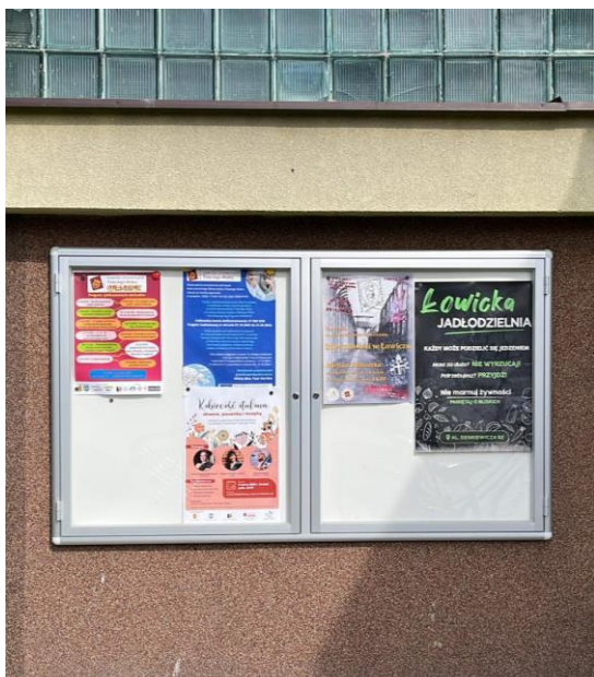
Fot. 6. Tablica ogłoszeniowa zewnętrzna dla NGO.

Łowickie stowarzyszenia mają możliwość korzystania z nośników reklamy w budynku Urzędu Miejskiego przy Al. Sienkiewicza 62, tj. telewizora w korytarzu głównym, tablic magnetycznych, mniejszych i dużych tablic - „potykaczy”, a także ekspozytora do ulotek i prospektów.