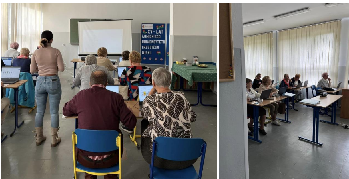
Fot. 5. Szkolenie z zakresu obsługi komputerów organizowane w łowickim Uniwersytecie Trzeciego Wieku.

Przy współpracy z Klubem Seniora „Radość” zorganizowano liczne szkolenia: