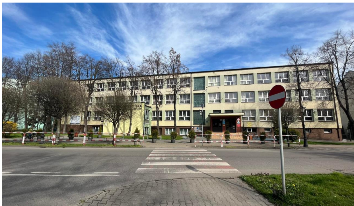
Fot. 3. „Budynek stowarzyszeniowy” – Al. Sienkiewicza 62.

Coraz bardziej dla NGO atrakcyjna jest przestrzeń sąsiadująca z budynkiem w Al. Sienkiewicza 62. Systematycznemu rozwojowi ulegają tu tereny zielone - tworzone są trawniki, sadzone drzewa i krzewy, pojawiają ławki i stojaki rowerowe. „Dziedziniec” obiektu chętnie wykorzystywany jest, jako miejsce organizacji pikników: Klubu Seniora „Radość”, Polskiego Związku Emerytów i Rencistów, Koła Diabetyków. Prowadzone są tu również zajęcia sportowe.