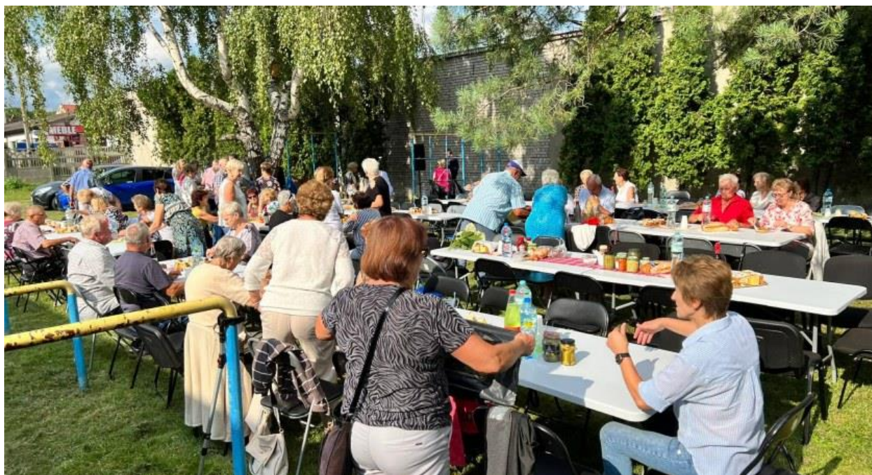
Fot. 4. Piknik Polskiego Związku Emerytów i Rencistów oddział Łowicz.

Coraz bardziej dla NGO atrakcyjna jest przestrzeń sąsiadująca z budynkiem w Al. Sienkiewicza 62. Systematycznemu rozwojowi ulegają tu tereny zielone - tworzone są trawniki, sadzone drzewa i krzewy, pojawiają ławki i stojaki rowerowe. „Dziedziniec” obiektu chętnie wykorzystywany jest, jako miejsce organizacji pikników: Klubu Seniora „Radość”, Polskiego Związku Emerytów i Rencistów, Koła Diabetyków. Prowadzone są tu również zajęcia sportowe.